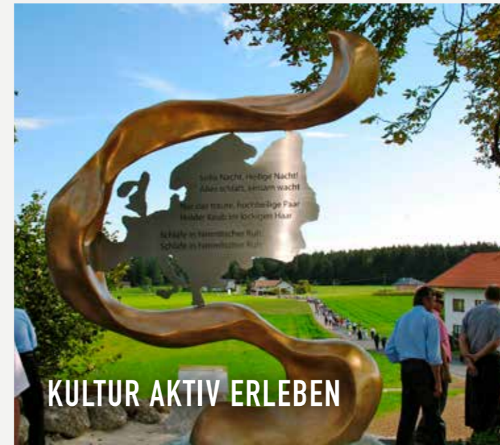
KULTUR AKTIV ERLEBEN