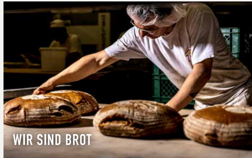
WIR SIND BROT